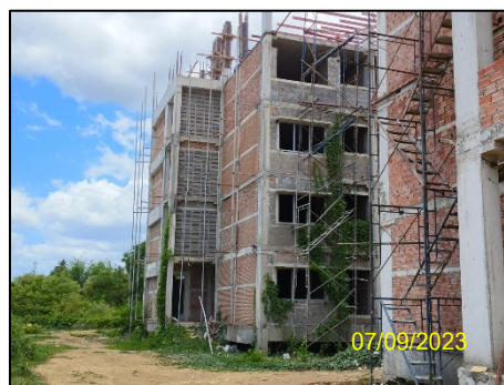
ภาพที่ 1-1 สภาพปัจจุบันของโครงการ